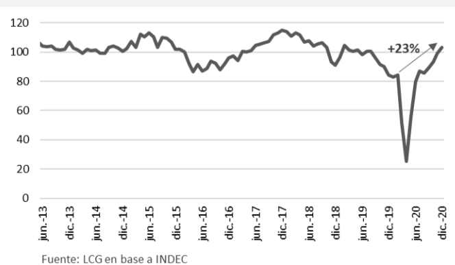
Actividad de la Construcción Serie desest. Ene-12=100